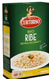
Riso Ribe Curtiriso Kg 1