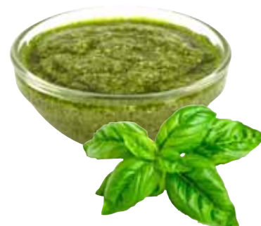
Pesto al Kg