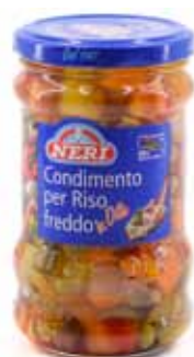
Condimento per riso Neri Gr 285