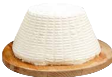
Ricotta della Fattoria Rimaggio al Kg