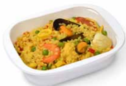
Paella Gr 300