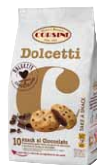
Dolcetti al cioccolato Corsini Gr 300