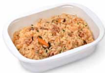
Risotto alla marinara Gr 300